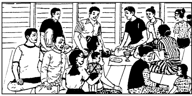
ຈິ່ງເສັງບົດທີ 18!

ຂອບໃຈພະເຈົ້າທີ່ພະເຢຊູຖະຫວາຍຊີວິດເທື່ອດຽວແລ້ວພວກເຮົາຈະໄດ້ລອດທາງຄວາມຕາຍຂອງພະອົງນັ້ນມາເຖິງປະຈຸບັນນີ້. ເທື່ອໃດທີ່ເຮົາມີໂອກາດຮັບສິນມະຫາສະນິດນັ້ນໃຫ້ເຮົາຮ່ວມຈິດຮ່ວມໃຈກັບພີ່ນ້ອງຄູິດສະຕຽນໃນ ການລະນຶກເຖິງຄວາມຕາຍຂອງພະອົງເພື່ອເຮົາ.